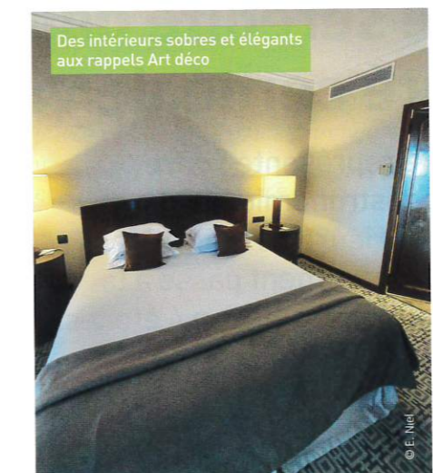
Des intérieurs sobres et élégants aux rappels Art déco