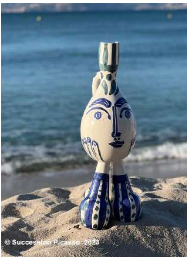
Pablo PICASSO (1881-1973) et Atelier MADOURA Vase tripode, 1951 Céramique émaillée Signé du cachet et numéroté 72/75 H. 75,5 cm 100.000 / 150.000 €