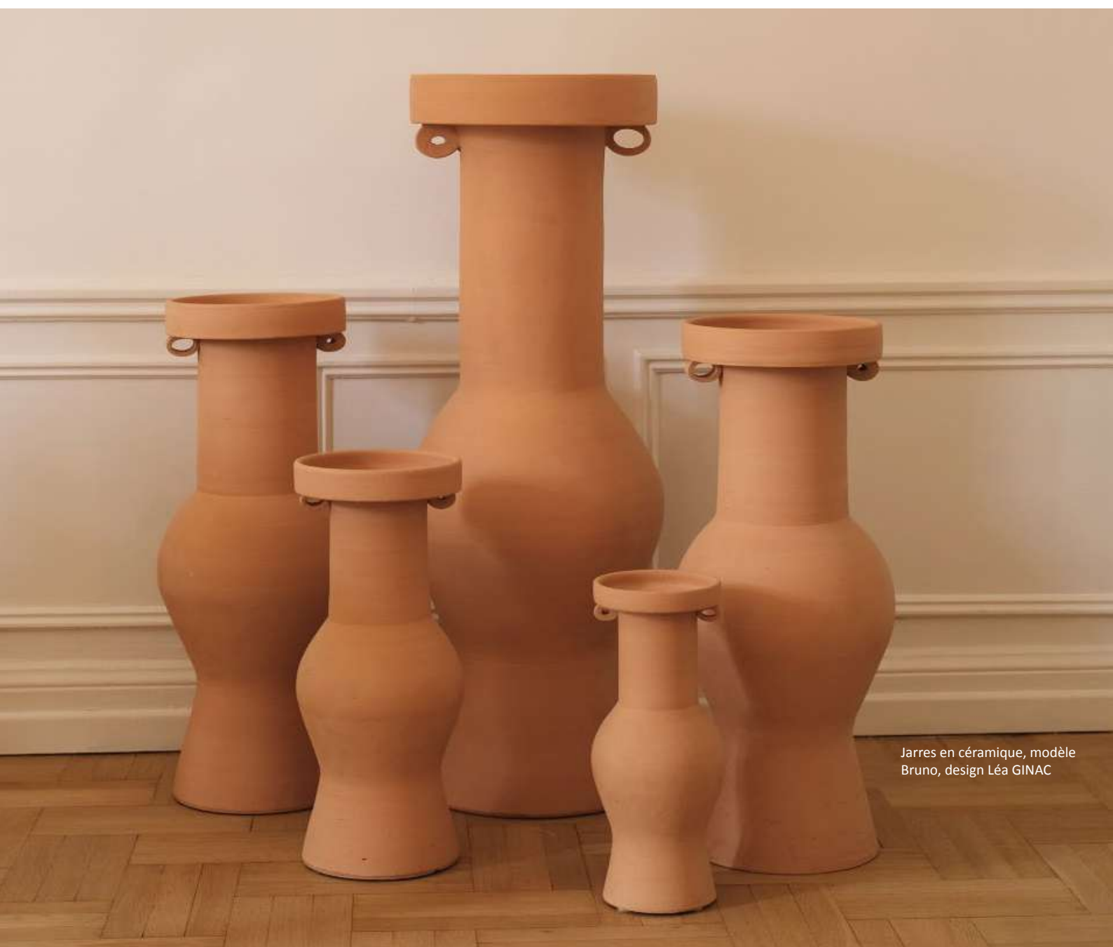
Jarres en céramique, modèle Bruno, design Léa GINAC