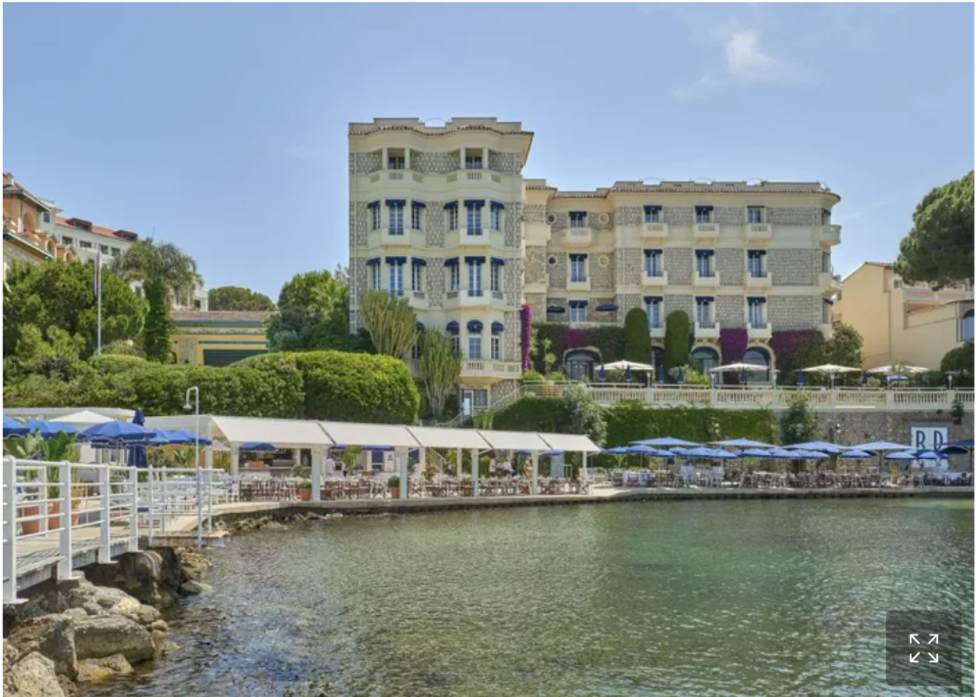
À Juan-les-Pins, Hôtel Belles Rives, l'esprit Fitzgerald.

Membre de Small Luxury Hotels of the World (SLH), cette villa Art déco où vécurent Scott et Zelda Fitzgerald conserve intact son parfum de Riviera littéraire. Le Belles Rives compte 43 chambres et suites, presque toutes ouvertes sur la baie, derrière ses célèbres stores rayés bleu et blanc. Son restaurant gastronomique La Passagère, étoilé Michelin, ajoute encore au charme de cette maison où l'on arrive presque en pensant entendre un vieux disque de jazz.