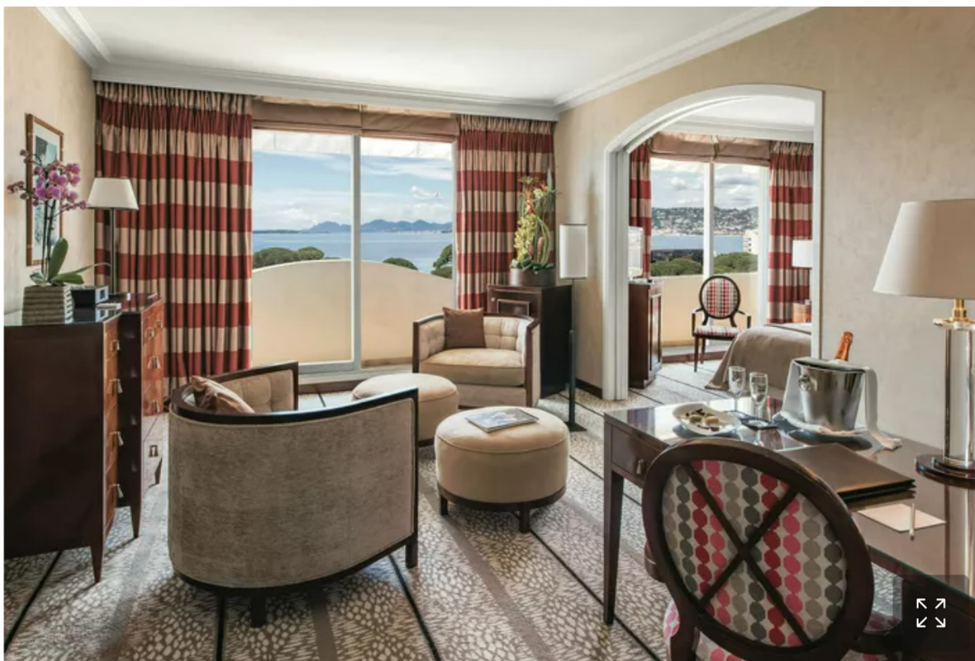
Hôtel Juana, glamour Art déco à Juan-les-Pins.

Voisin du Belles Rives, l'Hôtel Juana fait revivre depuis 1931 le faste de Juan-les-Pins dans une version plus solaire et plus lisse. Ce cinq-étoiles de 40 chambres et suites, propriété du même groupe familial et également membre de Small Luxury Hotels of the World, déploie un décor Art déco élégant entre marbres, miroirs et tonalités crème. Au bord de la piscine, l'ensemble évoque un club balnéaire de la Riviera d'autrefois remis au goût du jour.