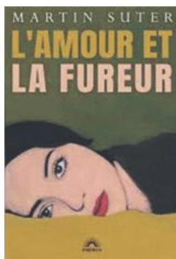
L'Amour et la Fureur MARTIN SUTER

Février 2026 Éditions Denoël & d'ailleurs